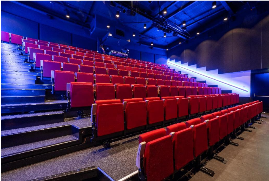
Lindenzaal met ledverlichting