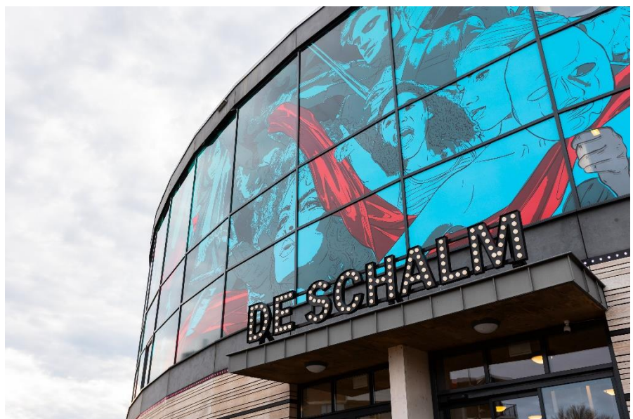
De gevel van De Schalm valt op en is een blikvanger.

Een pupil is ook een synoniem voor een leerling. De Schalm investeert in talentontwikkeling. Als middelgroot regiotheater is De Schalm bij uitstek een podium waarin nieuw talent van de kleine zaal naar de grote zaal kan doorgroeien om tenslotte in de grotere stadstheaters te kunnen staan. Zalen zoals De Schalm zijn daarom onontbeerlijk in het gehele culturele theaterlandschap.