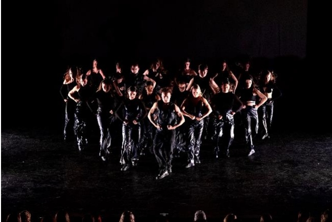
Dansgezelschap CDK Company