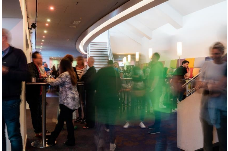
Bezoekers in de foyer

Nulmeting van een medewerkers tevredenheidsonderzoek.